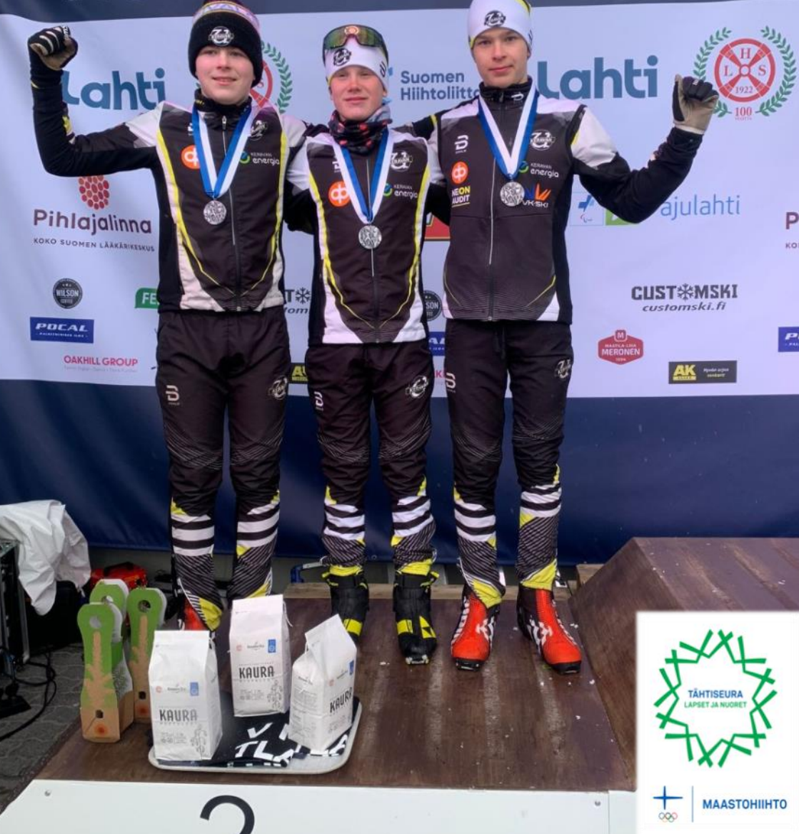
Keravan Urheilijat ry, hiihtojaosto