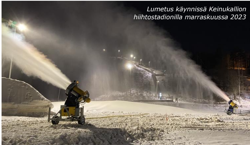
Lumetus käynnissä Keinukallion hiihtostadionilla marraskuussa 2023

Katso kalenterin takakannesta linkit lisätietoihin!