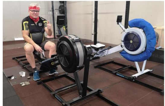
1 KUVA KERAVAN URHEILIJAT SOUTU FACEBOOK

Kaluston kunnostustalkoot järjestetään sunnuntaina 14.4. kello 13.00 alkaen Keupirtillä