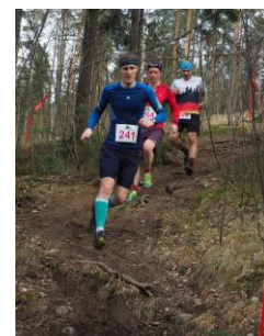
2 KUVA (SHERWOOD TRAIL RUN FACEBOOK)