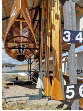
KUVA 1 KEU-SOUTU FACEBOOK

Kirkkovenetreeneit ovat alkaneet. Yhteiset harjoitukset ovat tiistaisin, torstaisin ja sunnuntaisin. Vene pyritään irrottamaan laiturista kello 18. Saavu paikalle hyvissä ajoit. Tervetuloa mukaan!